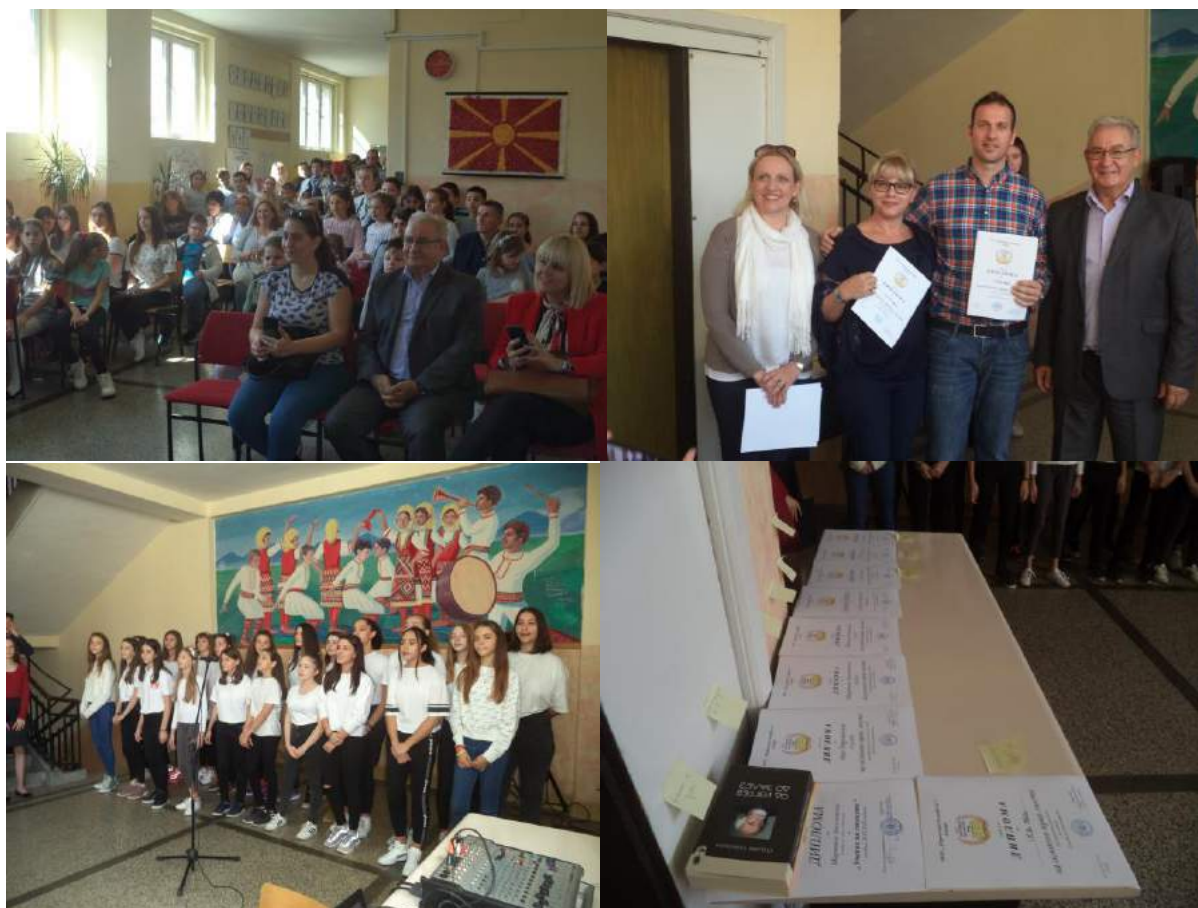
ООУ „Партенија Зографски“ - Скопје Сценарио за Денот на училиштето 24. 10. 2019 год. (13 ч.)

Активностите се реализираа со цел да се поттикнат учениците и вработените на креативност за значењето на децата за подобра иднина на заедницата